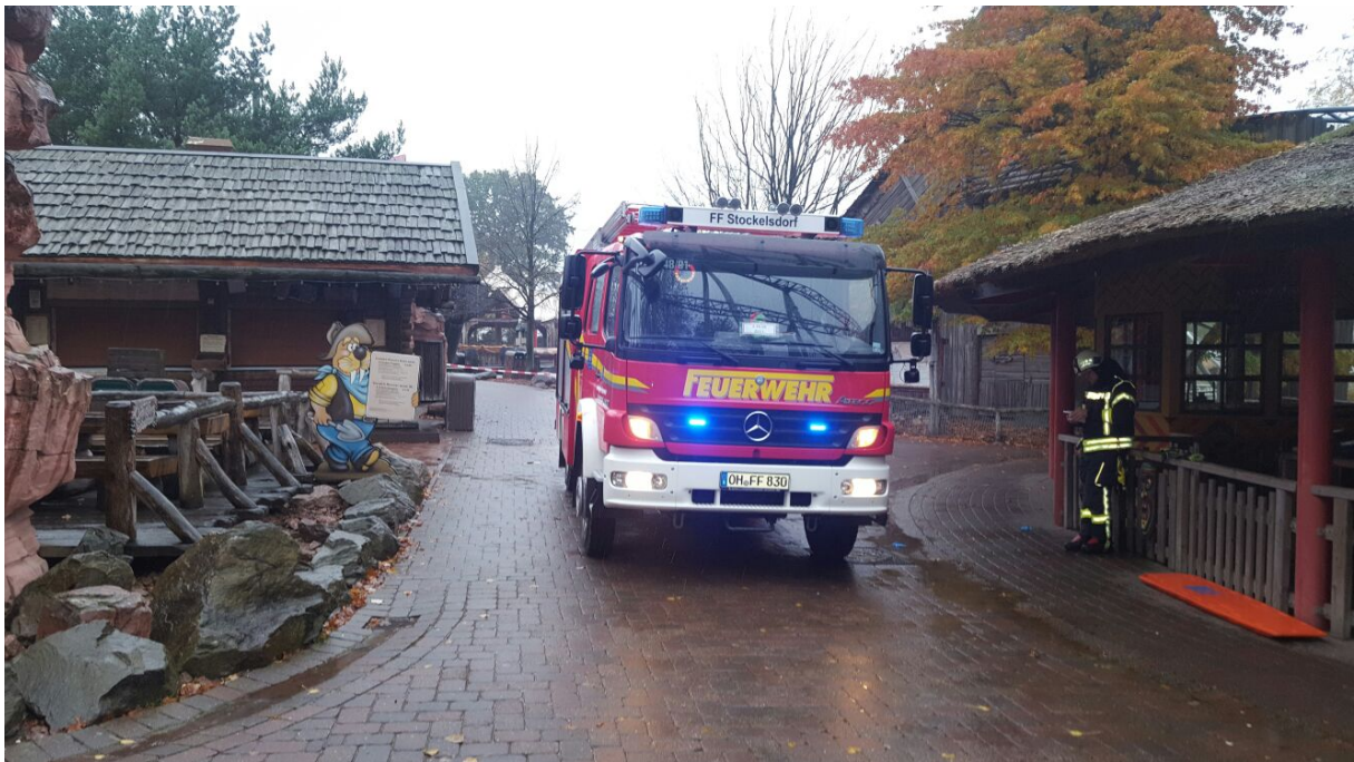
Ein Bericht von Rüdiger Weich, Bild von FF Stockelsdorf