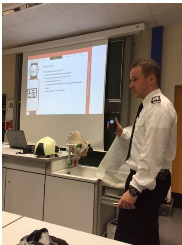
Ein Bericht und Bild von Rüdiger Weich

Die Einführung des Digitalfunks bei den Feuerwehren in Ostholstein rückt immer näher. In 2 Ausbildung-Veranstaltungen im November 2016 wurden die Kameradinnen und Kameraden der Freiwilligen Feuerwehr Stockelsdorf praktisch und theoretisch für die neue Technik geschult. Der erste Teil der Ausbildung widmete sich den Grundlagen und der Bedienung der neuen Funkgeräte und der zweite Teil beinhaltete eine praktische Funkübung. Die Ausbildung wurde durch Multiplikatoren-Ausbilder aus den Feuerwehren der Gemeinde Stockelsdorf durchgeführt. Die neue Technik bietet umfassende Möglichkeiten der Kommunikation im Feuerwehr-Einsatz und in der Zusammenarbeit mit anderen Behörden und Organisationen mit Sicherheitsaufgaben und vor allem eine sehr gute Sprachqualität und Verschlüsselung der Funk-Kommunikation.