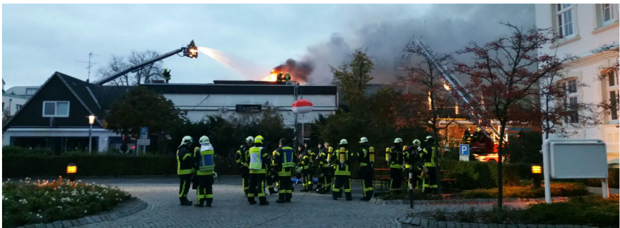
Ein Bericht von Rüdiger Weich

Am 26.10.2016 brannte in Timmendorfer Strand der Nautic Club (Diskothek). Der Club war zu diesem Zeitpunkt wegen Renovierungsarbeiten geschlossen. Gegen 5 Uhr wurden die Wehren der Gemeinde Timmendorfer Strand alarmiert, schnell wurde klar, dass dies ein länger andauernder Großeinsatz für die Feuerwehr wird. Kurz vor 7 Uhr wurden durch die Einsatzleitung Atemschutzgeräteträger der Gemeinde Stockelsdorf zur Unterstützung angefordert. Die Feuerwehren der Gemeinde Stockelsdorf rückten mit ca. 50 Einsatzkräften an, davon 45 Atemschutzgeräteträger. Die Freiwillige Feuerwehr Stockelsdorf war mit 13 Einsatzkräften vor Ort, davon 11 Atemschutzgeräteträger. Insgesamt waren weit über 100 Einsatzkräfte verschiedener Feuerwehren aus dem Süden des Kreises Ostholstein vor Ort, u.a. mit 3 Hubrettungsfahrzeugen. Das Feuer war einer der größten Brände, die es je in der Ortsmitte von Timmendorfer Strand gab, der Schaden liegt im Millionen-Bereich.