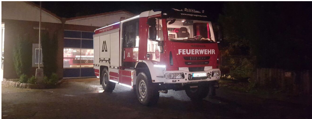
Ein Bericht von Rüdiger Weich

Am 11.11.2016 führte die Firma Magirus aus Ulm ein Löschfahrzeug LF 10 bei der FF Stockelsdorf vor. Magirus ist eine von mehreren Firmen, deren Produkte wir uns im Zuge der Vorbereitung der Ausschreibung eines neuen Löschfahrzeuges in der Zukunft vorführen lassen. Es handelte sich um ein Fahrzeug der neuen EC-Line mit neuer Mannschaftskabine, die von Magirus erst letztes Jahr auf der Fachmesse Interschutz in Hannover vorgestellt wurde.